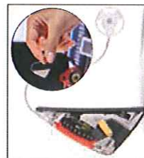
Hörgerät: hoch tech im MiniFormat. Foto: athen

Will man Menschen mit Hörproblemen wirkungsvoll helfen, muss man den Hörvorgang in all seinen Einzelheiten verstehen. Voraussetzung dafür sind Kenntnisse unter anderem in Akustik, Medizin, Psychologie und elektronischer Sprachsignalverarbeitungstechnik.